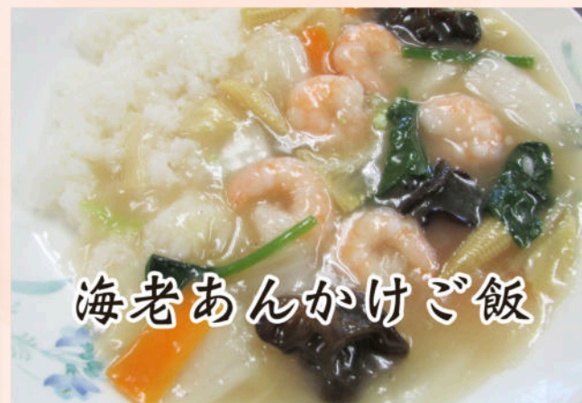
海老あんかけご飯