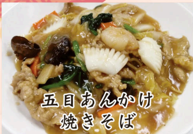
五目あんかけ 焼きそば