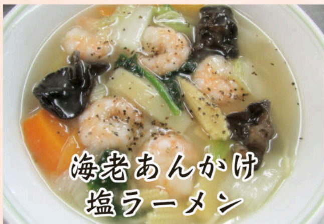
海老あんかけ 塩ラーメン