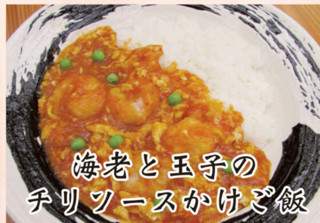
海老と玉子の チリソースかけご飯