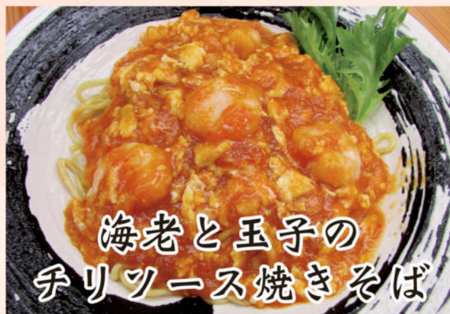
海老と玉子の チリソース焼きそば