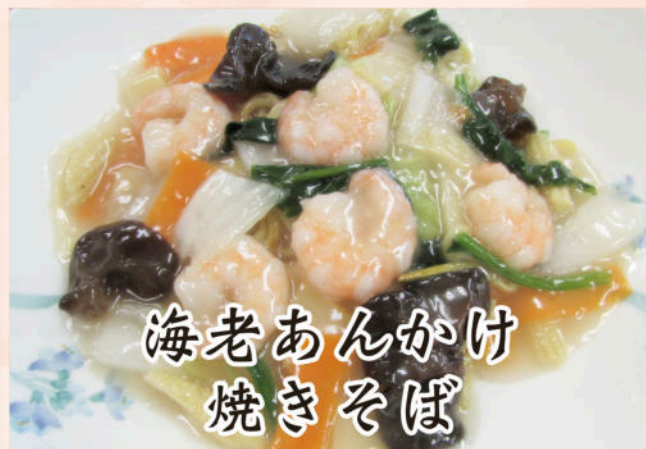
海老あんかけ 焼きそば